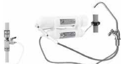
схема подключения крана №4 только для систем обратного осмоса Гейзер-Престиж 2

После подключения открыть кран чистой воды, осторожно открыть подачу воды в фильтр, затем закрыть кран чистой воды и проверить все соединения на герметичность. При обнаружении течи перекрыть подачу воды, устранить неисправность и повторить проверку.